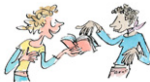
8. Het recht om stukjes na te lezen.