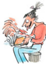
2. Het recht om bladzijden over te slaan.