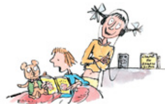
9. Het recht om hardop te lezen.