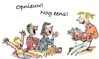
4. Het recht om een boek nog eens te lezen.