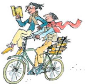
7. Het recht om waar dan ook te lezen.