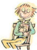
10. Het recht om er stil van te worden.

10 rechten - 1 waarschuwing lach mensen die niet lezen niet uit, want dan zullen ze nooit lezen.