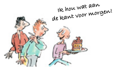
3. Het recht om een boek niet uit te lezen.