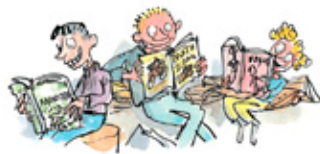
5. Het recht om wat dan ook te lezen.