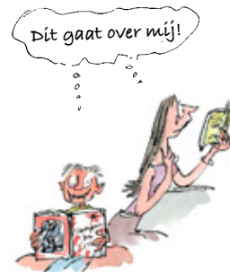
6. Het recht om zich te identificeren met een personage.