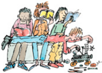
1. Het recht om niet te lezen.

Door Daniel Pennac, geïllustreerd door Quentin Blake.